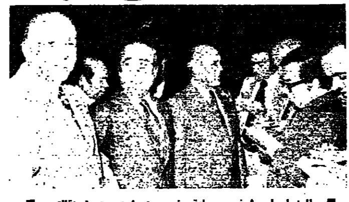
الوزراء ابو شرف وسعادة وتيم بختون عن استقلالهم